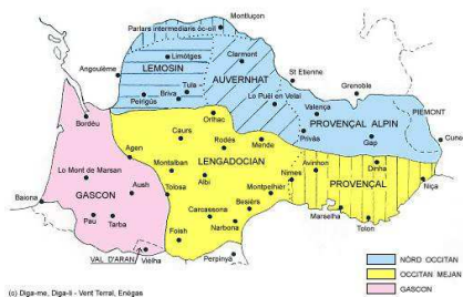
FIGURE 1 – Dialectes de l'occitan (Carles, 2005)

L'occitan est une langue romane, parlée dans le sud de la France, dans le Val d'Aran en Espagne et dans 12 vallées alpines d'Italie. Faute d'étude spécifique, il est difficile d'estimer le nombre de locuteurs occitanophones. Diverses études annoncent des chiffres allant de 600 mille à 2 millions de locuteurs (Martel, 2007). Cette langue connaît une variation interne relativement importante. Elle regroupe un ensemble de variétés organisées en dialectes :